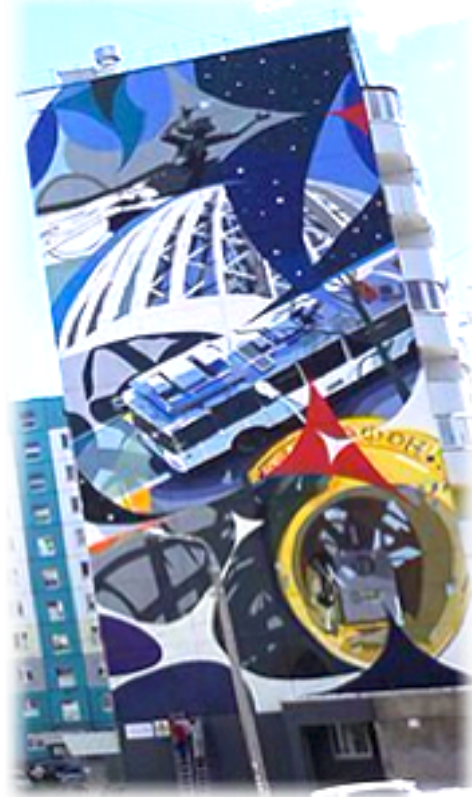
Россия (Екатеринбург) «Летящая муза» Авторы – Максим Реванш и Ян Каплан