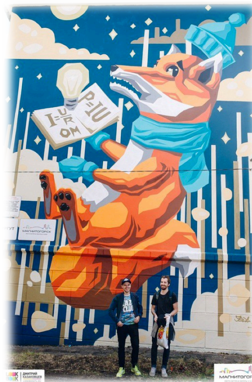
Россия (Сургут) «Лисенок» Авторы - Борис Карасев и Александр Марков