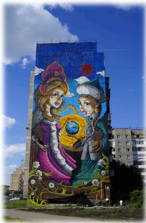
Россия (Магнитогорск) «Магнитогорск – место встречи Европы и Азии» Авторы - Дмитрий Платонов и Михаил Котлованов