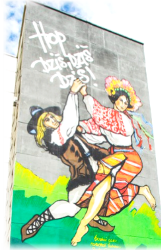
Польша «Коломыйка» Авторы - Рафал Росковиньски и Войчех Возьняк