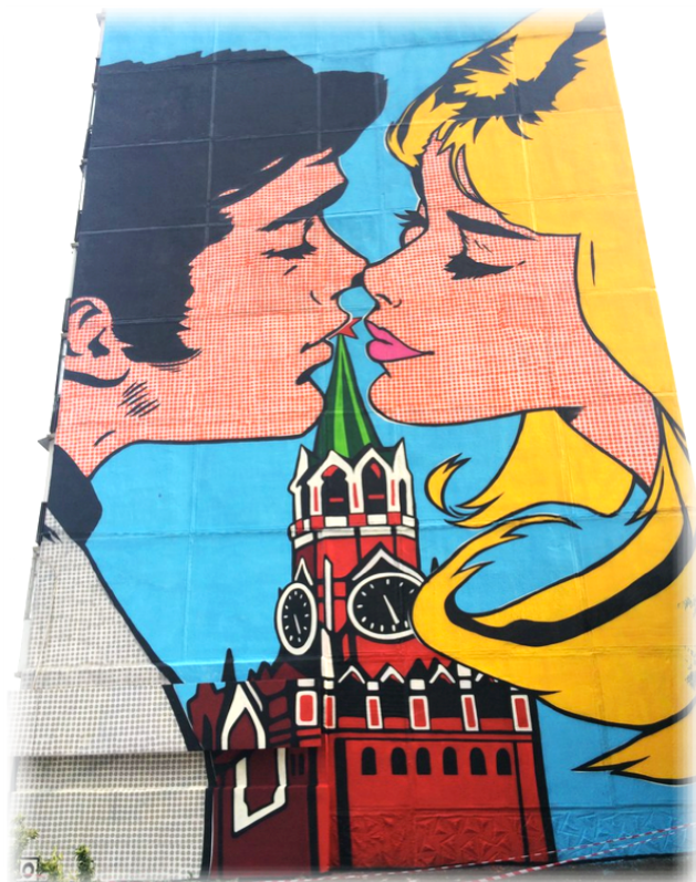
Россия (Москва) «Люблю тебя» Авторы - Степан Краснов и Андрей Целуйко